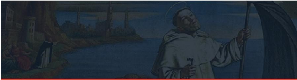
Saint of the Week