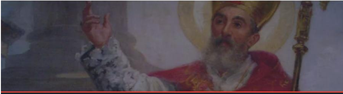
Saint of the Week